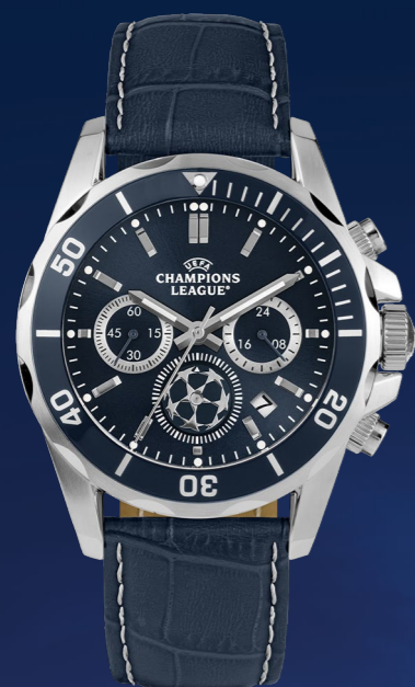
CL-103A 249 €