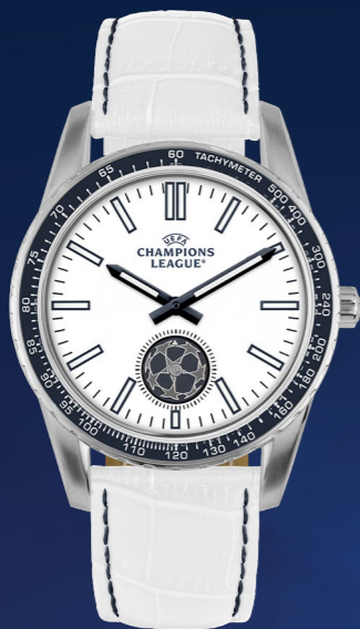
CL-101C 149 €