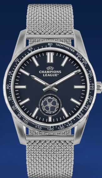
CL-101B 149 €