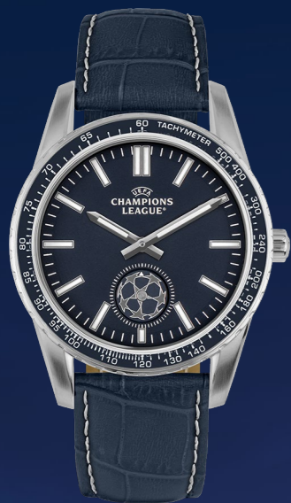
CL-101A 149 €