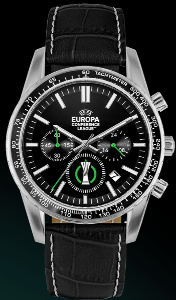
ECL-101A 199 €