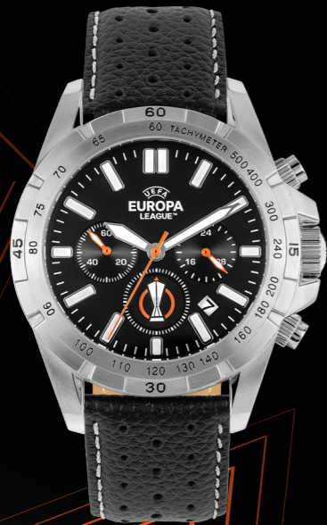
EL-101A 199 €