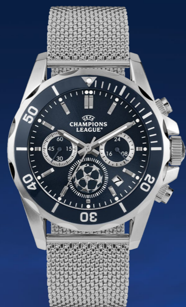
CL-103B 249 €