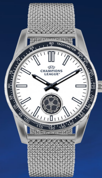
CL-101D 149 €