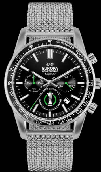
ECL-101B 199 €