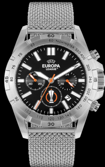
EL-101B 199 €