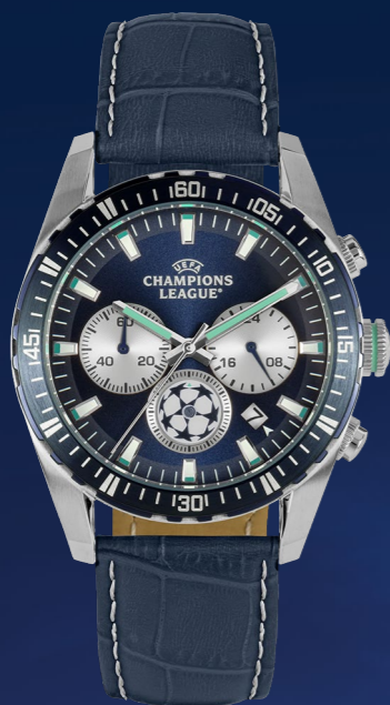
CL-102A 249 €